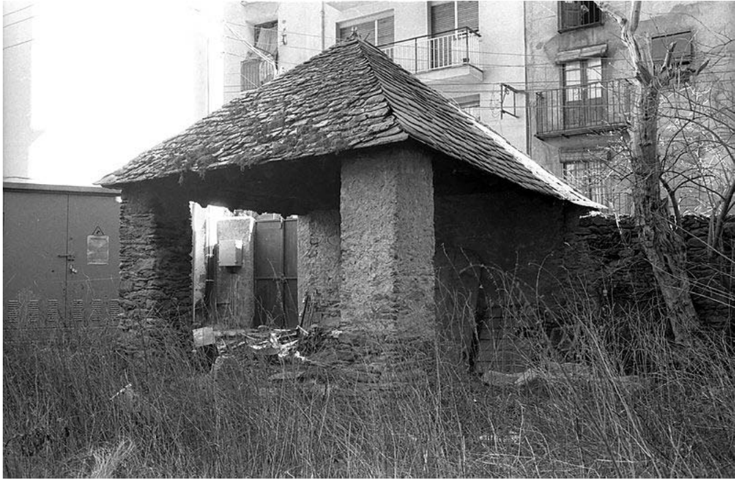
Comunidor de l'església de Sant Julià de Lòria. Sense data

Com podem apreciar en la foto, son construccions simètriques i sòlides, en principi obertes als quatre vents, fetes de pedra amb teulada de llosa a quatre vessants. Ja fa segles que estan en desús. En el cas de Sant Julià de Lòria, en el moment de la seva construcció és molt probable que el comunidor estigués, com era habitual, obert cap als quatre punts cardinals. Més tard, amb la construcció d'habitatges al carrer Cavallers (antic carrer Palau), una de les façanes va quedar tapada. Les obertures permetien al sacerdot orientar-se cap al punt per on venien els núvols en el cas de tempesta.