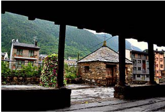
Comunidor de l'església de Santa Eulàlia d'Encamp.