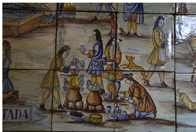
Detall de 'La xocolatada' 1710 Museu del Disseny de Barcelona

El llibre d’actes de la Germandat del Carnestoltes que es conserva a l’Arxiu del Comú de Sant Julià de Lòria dona pistes valuoses sobre el funcionament d’aquesta consòrcia on no hi entraven ni dones ni fadrins. A més de preocupar-se per les ànimes del purgatori i els pobres, es preocupava també del compliment del dejú dels seus membres durant la quaresma. I si calia donar xocolata, tots contents.