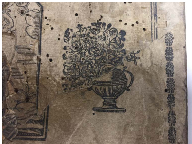
Detall ornamental dels goigs de Sant Sebastià. Arxiu del Comú de Sant Julià de Lòria

És el que es coneix com les festes votades , entre les quals destaca l'advocació de Sant Sebastià. La podem trobar, entre altres, a Alaró (Mallorca), el Pelegrí de Tossa a Santa Coloma de Farners (Selva), la festa del Figueró a Vallcarca (Vallès Oriental) o a la població veïna de la Seu d'Urgell, on continua essent un dia festiu. En la pàgina web del Bisbat d'Urgell, www.bisbaturgell.org podem llegir: "La Seu d'Urgell, com moltes d'altres poblacions catalanes, sota els estralls de la pesta a mitjans del segle XIX va posar-se sota l'advocació de Sant Sebastià, patró que s'invocava per a salvar-se de la còlera".