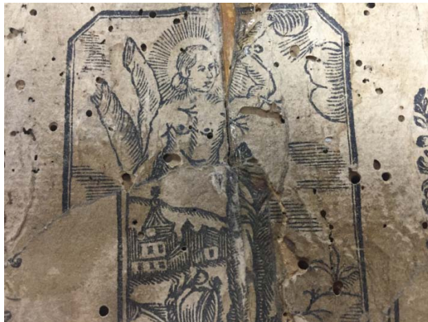
Detall dels goigs de Sant Sebastià amb la representació del sant.

Els goigs comencen amb unes referències a la biografia del sant i la tornada parla de la seva capacitat per guarda “dels treballs de pestilència”.