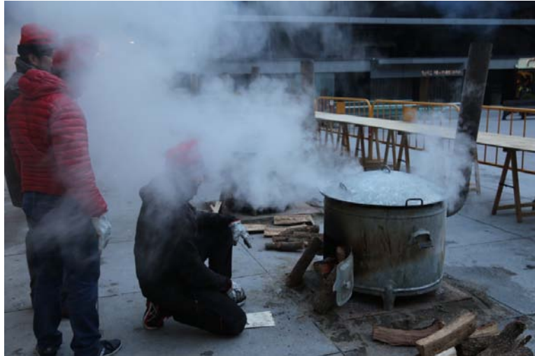
Preparació de l'escudella de Sant Sebastià.